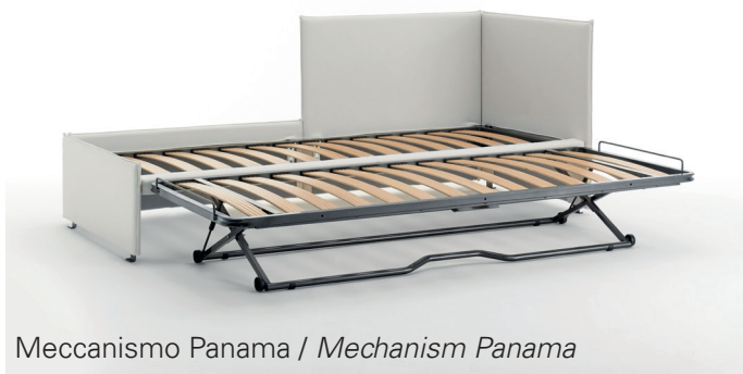
Meccanismo Panama / Mechanism Panama

Materials: Polyurethane mattress is made by a polyurethane foam core with no C.F.C., non-deformable, covered with a heat sealed layer. The covering fabric is in polyester and modacrylic fiber. All materials are fire retardant and moreover mattresses are 1 IM fire reaction class in accordance with the strict laws of Italian rules.