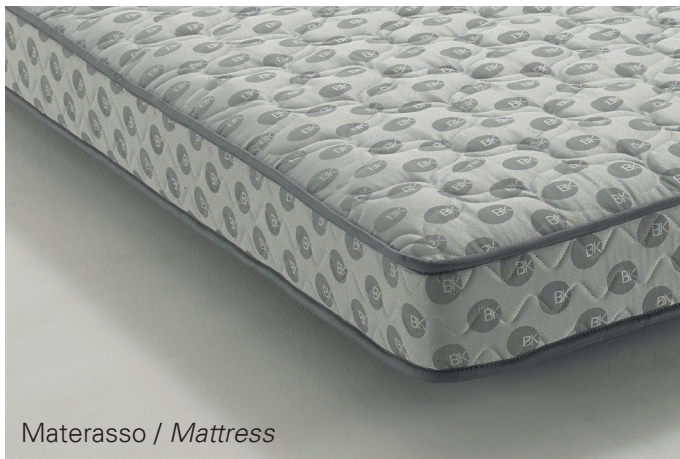
Materasso / Mattress