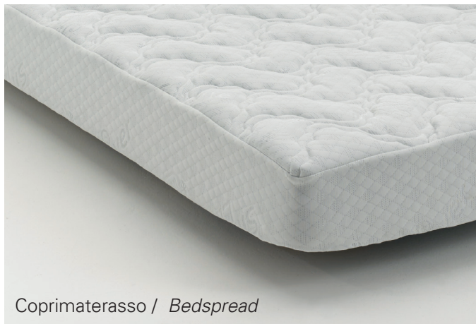
Coprimaterasso / Bedsread